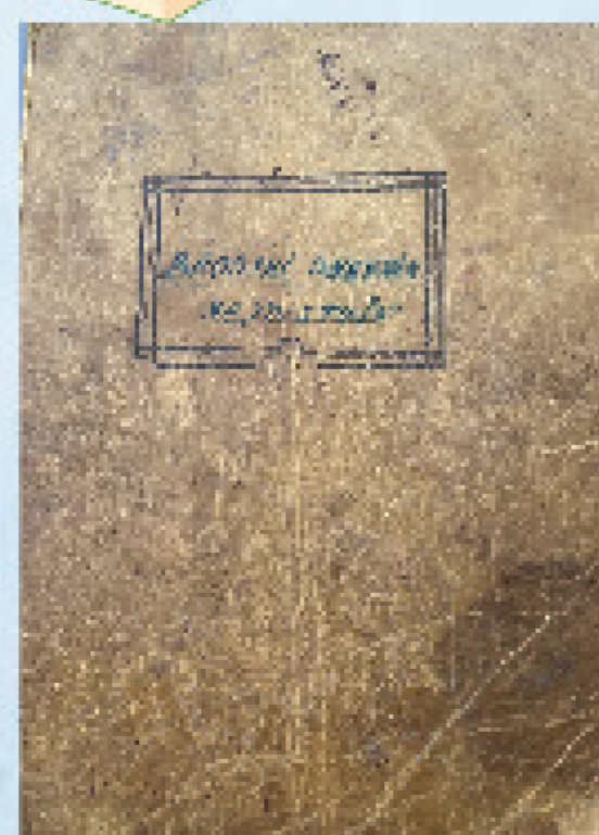
Brodski dnevnik plivarice Poletuše, 50-te godine