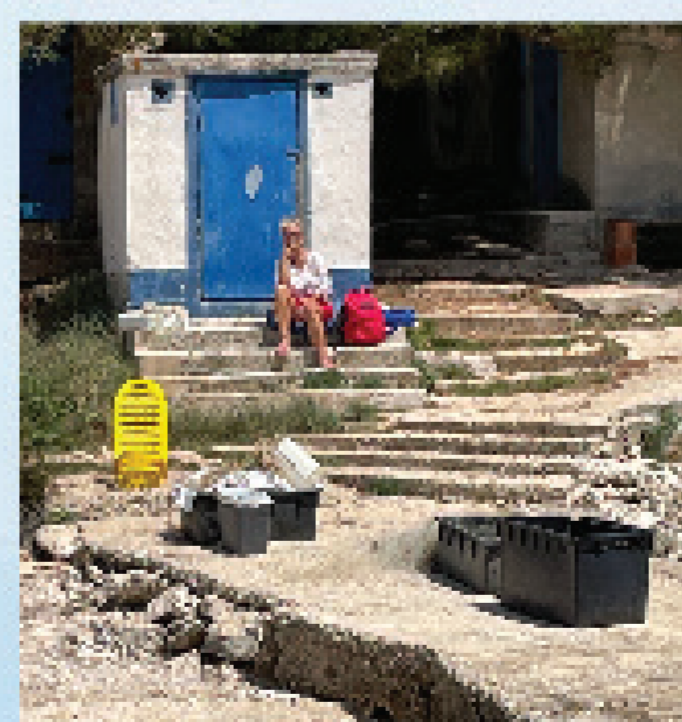
Ribarsko "mulo", ribarske barake i oprema, Premantura, 2022.