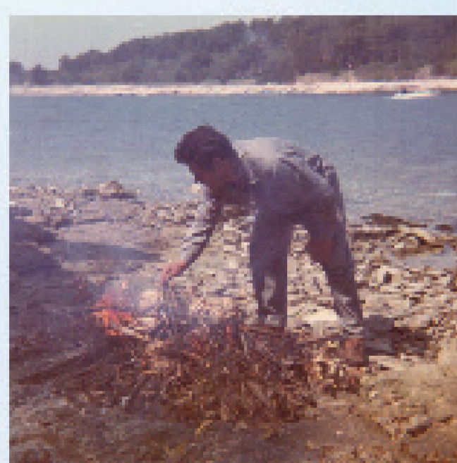
FRAŠKA - oganj u koji se je bacala živa tek ulovljena rakovica - česta prehrambena namirnica ribara