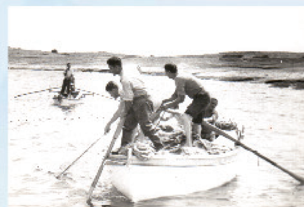
Opasivanje ribe mrežom plivaticom oko obale Premanture