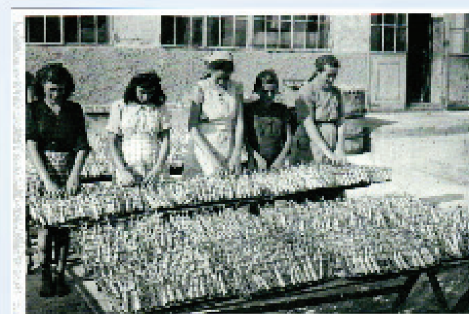
Radnice u tvornici za preradu ribe u Banjolama popularno zvane SRDELINE

4 | => IDEJA - odlučila sam spasiti maritimnu baštinu općine Medulin (jug Istre) od zaborava => ISTRAŽIVANJE - terenski rad => INFORMACIJA - arhivi, ustanove u kulturi, znanstveni radovi => INTERPOLACIJA - pisanje monografije, umrežavanje struke i ribara, izrada ribarske opreme, makete banjolske batane, PR, predavanja, SEO, AI