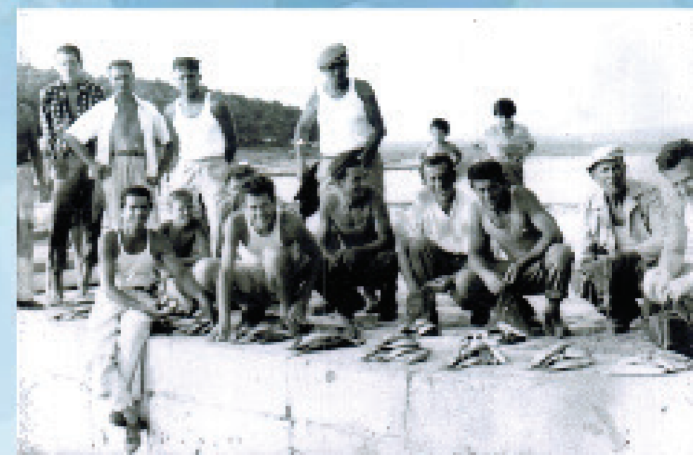
POGADA PLIVARICE 'HRVATICE' U PREMANTURI DIELI KONJUZ (dio dnevnog ulova za vlastite potrebe)