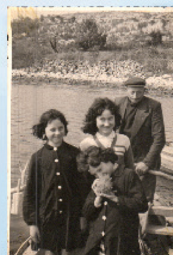
Popularne "rake" lovile su i djeca sa svojim didom